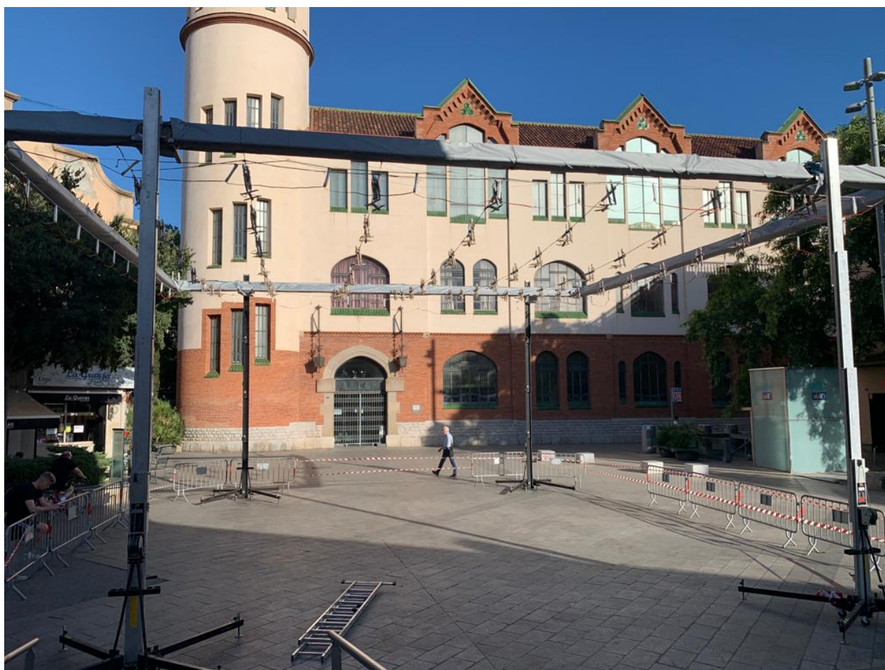
Imatge del muntatge bàsic que es va fer el setembre del 2022

L'adjudicatari, el mateix dia del muntatge, haurà d'aportar el certificat de solidesa de tota l'estructura signat per un enginyer i aportar la documentació que s'estableix al RD 989/2015, de 30 de octubre, Reglamento de artículos pirotécnicos y cartuchería . Així com el certificat NEC.