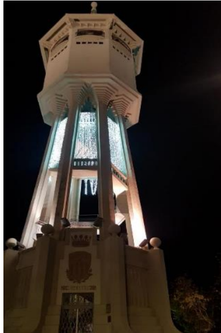
Exemple d'instal·lació lumínica a la Torre de l'Aigua