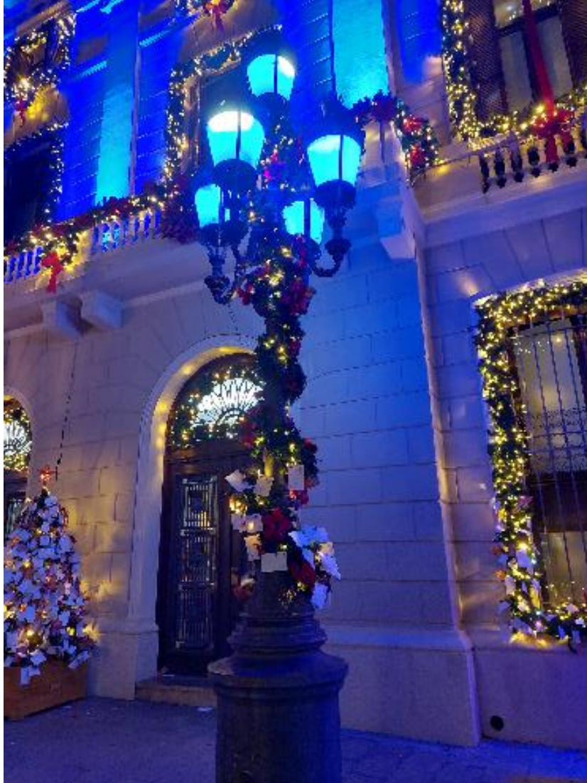
Exemple d'instal·lació lumínica i ornamentació dels 2 fanals modernistes