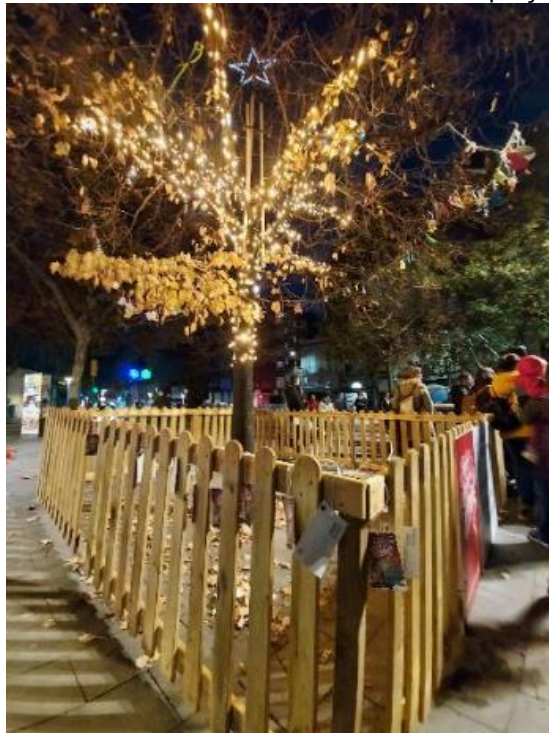
Exemple d'instal·lació lumínica en un arbre natural de la plaça de La Creu Alta