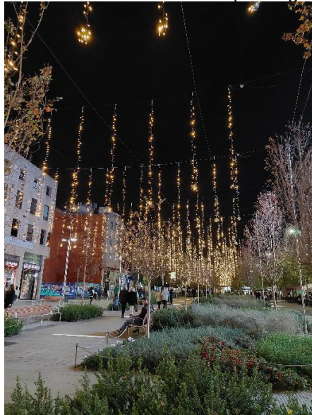
Exemple d'instal·lació lumínica del passeig de la Plaça Major