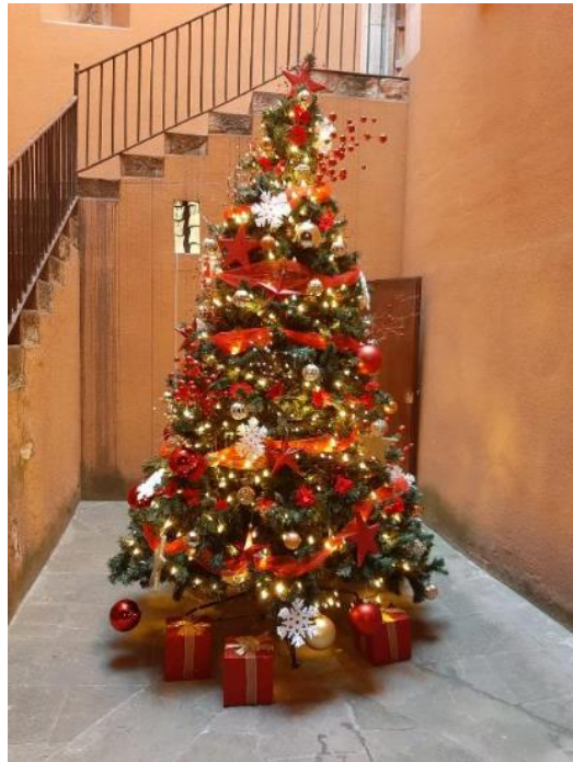
Exemple d'instal·lació d'arbre de Nadal de 3 metres a la Casa Duran