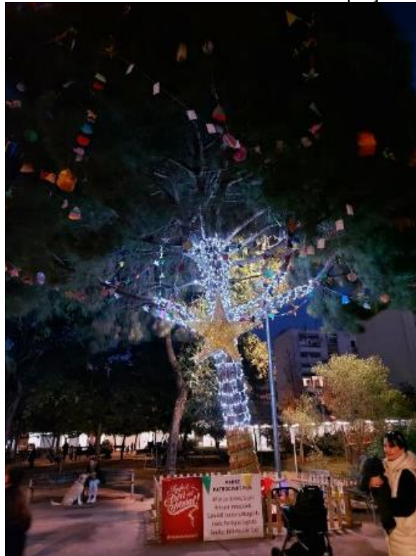
Exemple d'instal·lació lumínica en un arbre natural de la plaça de de Les Termes