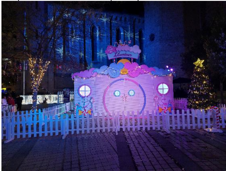
Exemple d'instal·lació de les tanques de perímetre de la Caseta del Llaminer