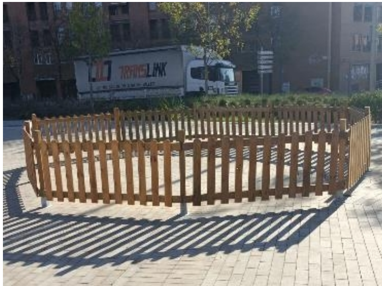
Exemples d'instal·lació de tanques de fusta per a l'arbre de la plaça de Còrdova