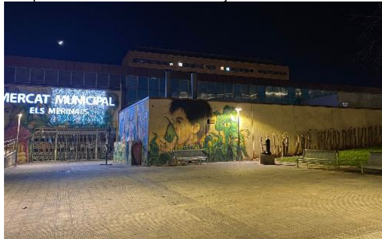
Exemple d'instal·lació lumínica a la façana del Mercat Els Merinals