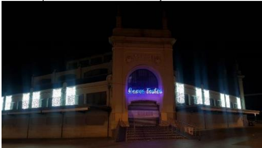
Exemple d'instal·lació lumínica a la façana del Mercat Central