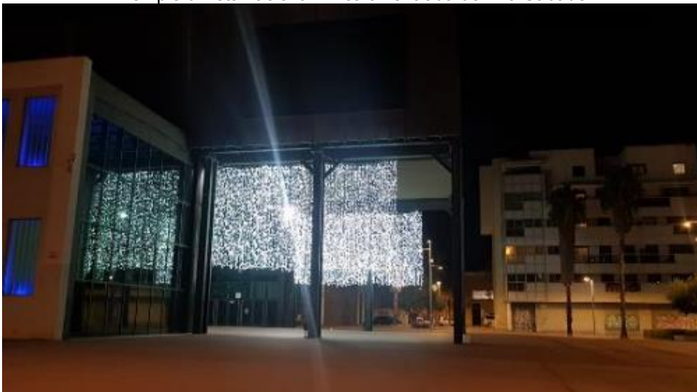
Exemple d'instal·lació lumínica a l'entrada de Fira Sabadell