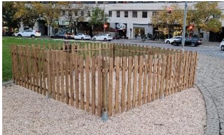
Exemples d'instal·lació de tanques de fusta per a l'arbre de la plaça d'Espanya