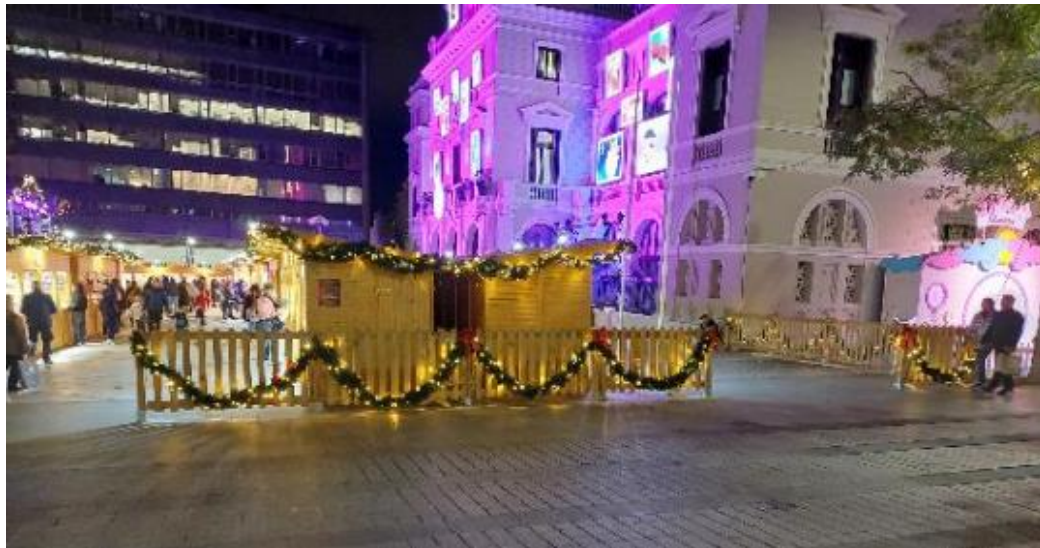
Exemple d'instal·lació de guinardes amb llum led i llaçada vermella a les tanques de la Fira de Santa Llúcia