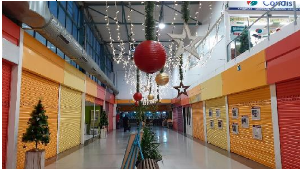
Exemple d'instal·lació lumínica a l'interior del Mercat Els Merinals