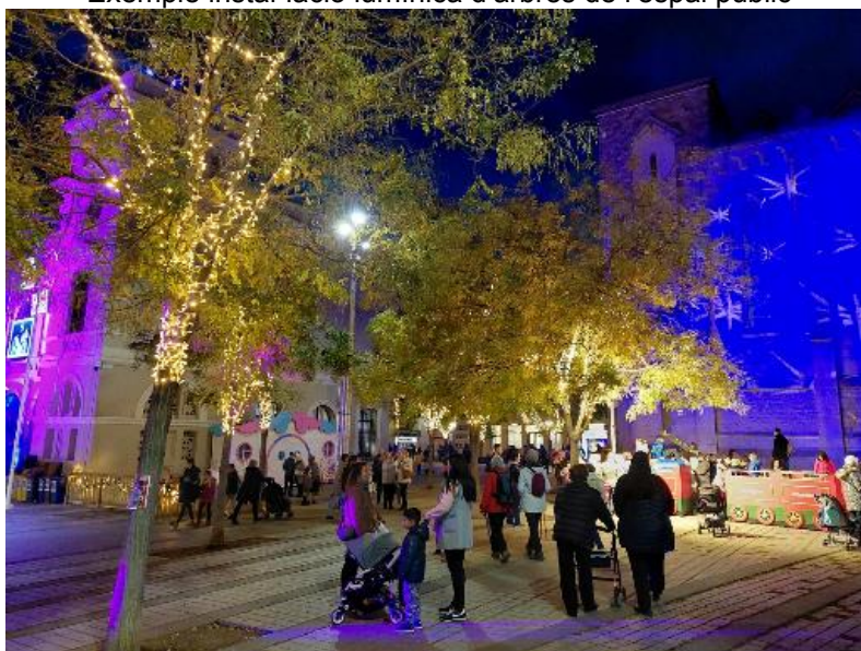
Exemple instal·lació lumínica d'arbres de l'espai públic