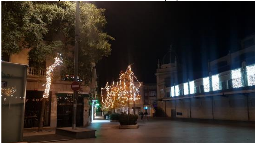
Exemples d'instal·lació lumínica a la plaça del Mercat