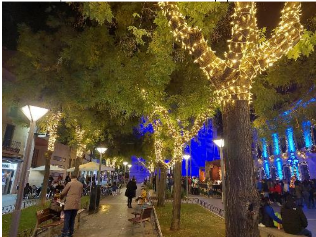
Exemple d'instal·lació lumínica dels arbres de la plaça de Sant Roc